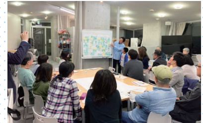
再活用を検討するワークショップの様子