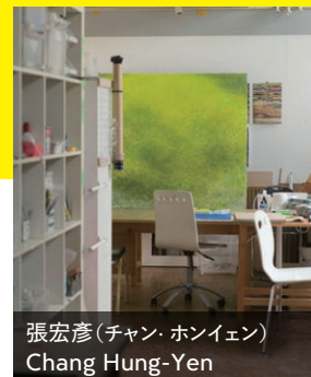
張宏彦(チャン・ホンイェン) Chang Hung-Yen

まずはインフォメーションへ 今年も塚田商店がインフォメーションに! チケットのお買い求めや当日のイベント情報のチェックにお立ち寄りください。