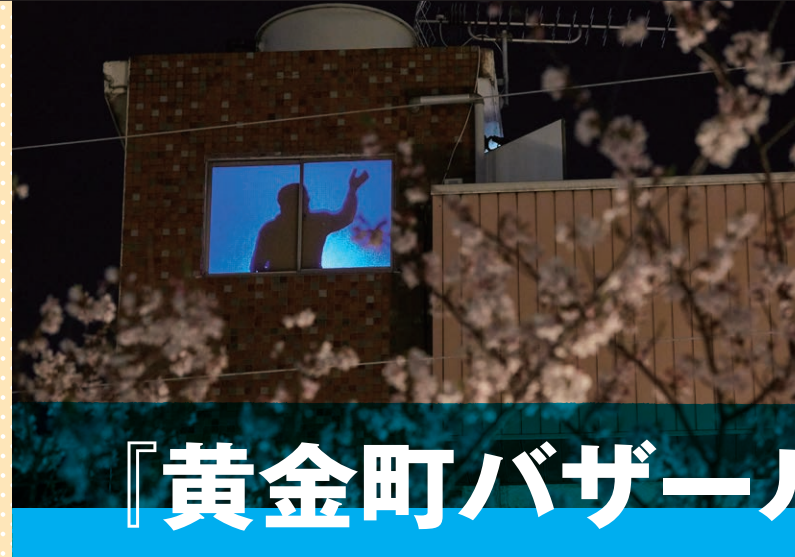
瀧健太郎『応答する都市』2024