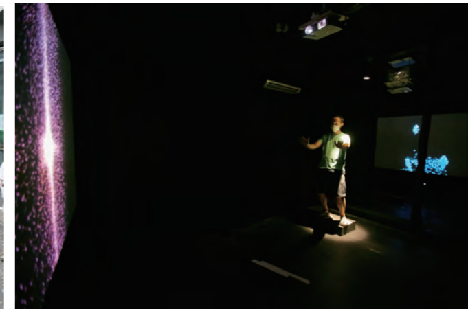
レイモンド・ホラチェック《SUPERPOSITION》