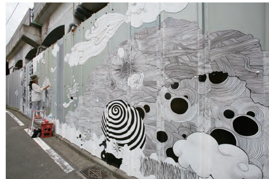
キム・ガウン 公開制作風景

コロナ禍で様々な制約のもと実施した第1部でしたが、2万人を超える方々にご来場いただき、想定を遥かに上回る盛況ぶりでした。ご来場いただきました皆さま、開催にあたりご支援ご協力いただきました皆さま、そして参加アーティストの皆さま、本当にありがとうございました! 11月6日からの第2部にもご期待ください!